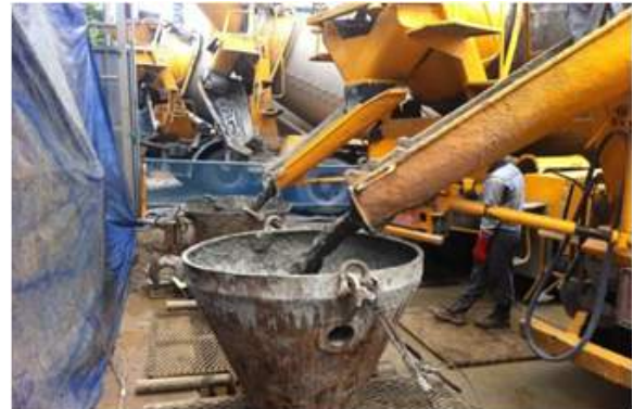
&lt;그림 7&gt; 공정별 시공 전경