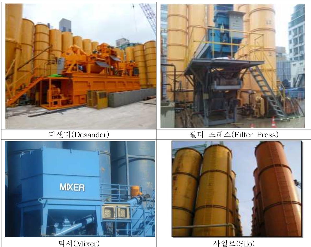
<그림 9> 플랜트를 구성하는 주요 장비