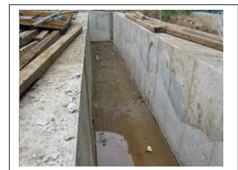
<그림 1> 안내벽 전경

(가) “안내벽(Guide Wall)”이라 함은 지하연속벽을 만들기 위해 그 양측에 설치하여 굴착시 충격에 의해 표토층이 무너지는 것을 방지하고 철근망 및 트레미관 삽입시 받침대 역할을 하는 철근콘크리트 벽체구조물을 말하며 보통 1,200 ~ 1,500mm 깊이로 설치한다.