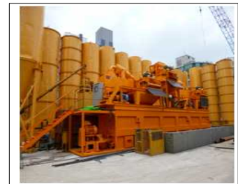
<그림 4> 플랜트 전경