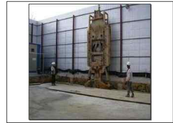
<그림 2> 선행굴착 전경

(2) 기타 이 지침에서 사용하는 용어의 정의는 특별한 규정이 있는 경우를 제외하고는 산업안전보건법, 같은법 시행령, 같은법 시행규칙, 산업안전보건기준에 관한 규칙에서 정하는 바에 의한다.