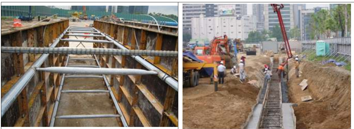
<그림 8> 안내벽의 거푸집 설치 및 콘크리트 타설 전경