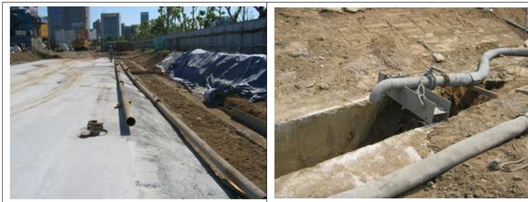
<그림 10> 안정액 배관 설치 전경