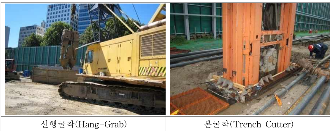
<그림 12> 선행굴착 및 본굴착 전경

(13) 굴착이 완료된 상태로 오랜 기간 방치하여서는 아니 되며, 철근망을 삽입하기 전까지는 근로자의 추락재해를 방지하기 위하여 견고한 철망 등으로