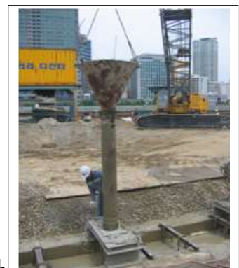
<그림 5> 트레미관