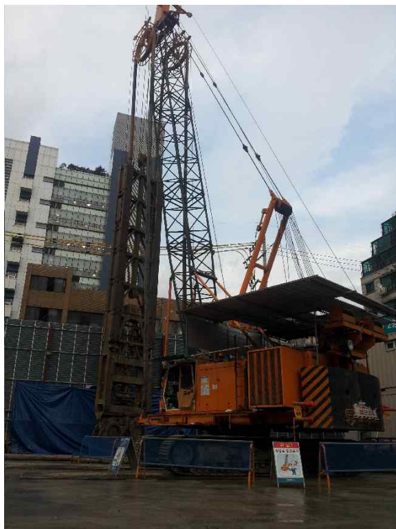
④ 본 굴착