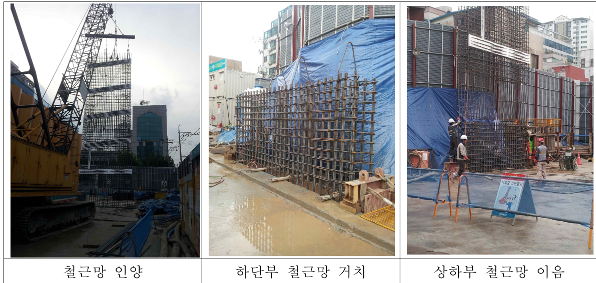
<그림 13> 철근망의 삽입 절차