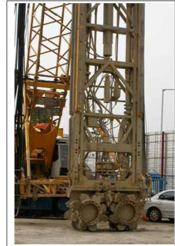
<그림 3> 트렌치 커터