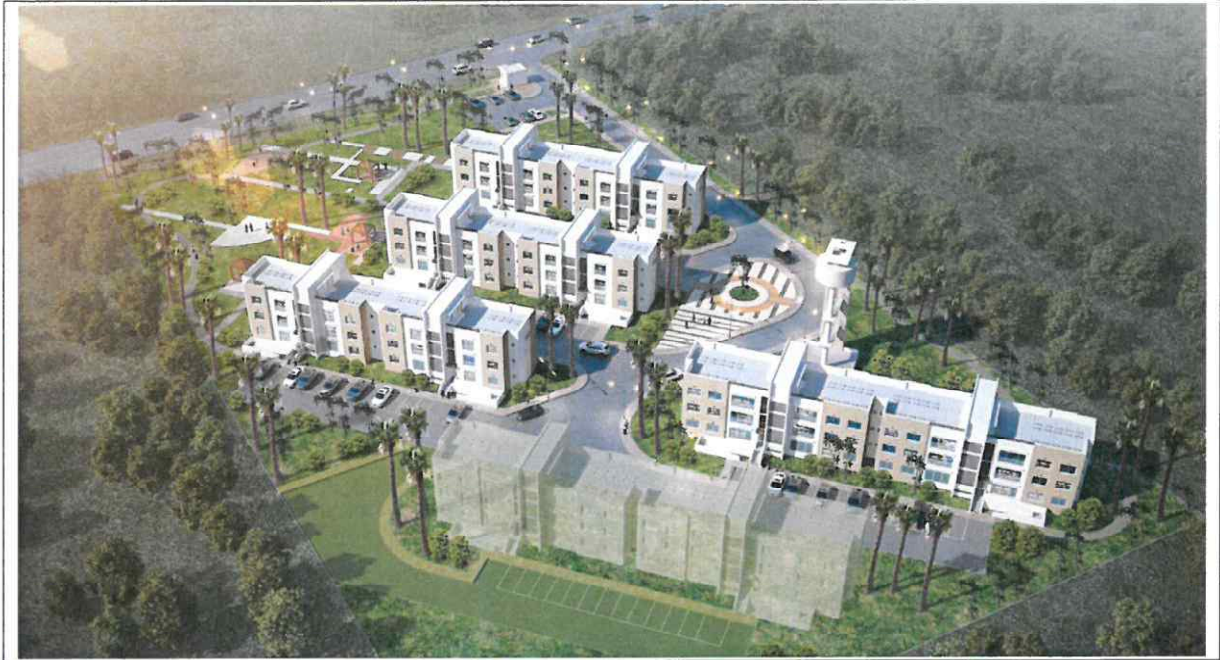
<그림 2> 의료진 숙소 조감도

* 상기의 조감도는 48세대(2-bedroom type 36EA, 3-bedroom type 12EA)