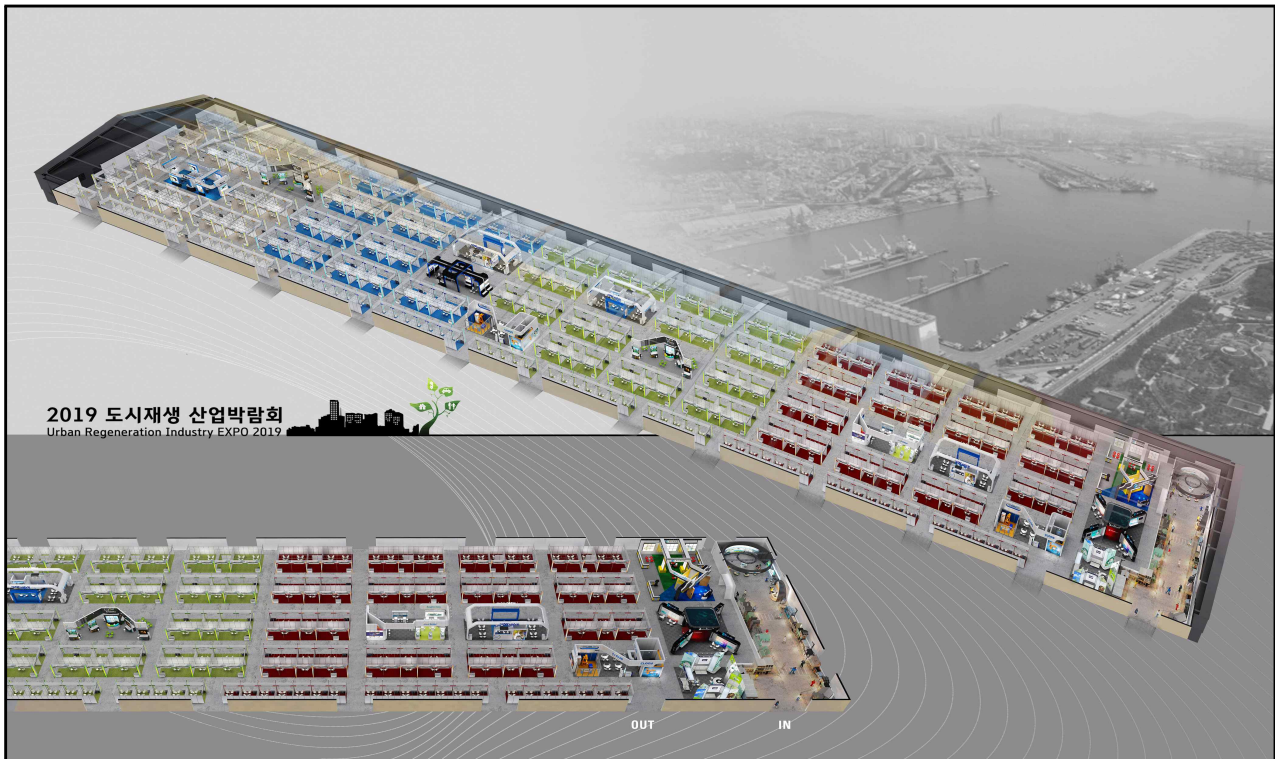
행사장 배치도 (예상도)